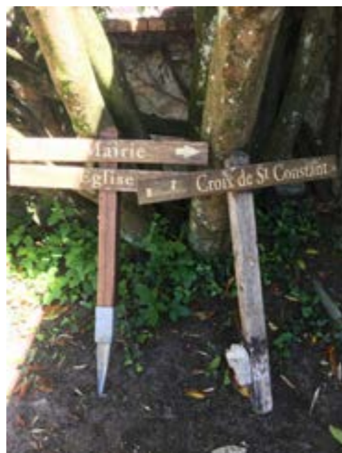
Croix de chemin arrachées, retrouvées,