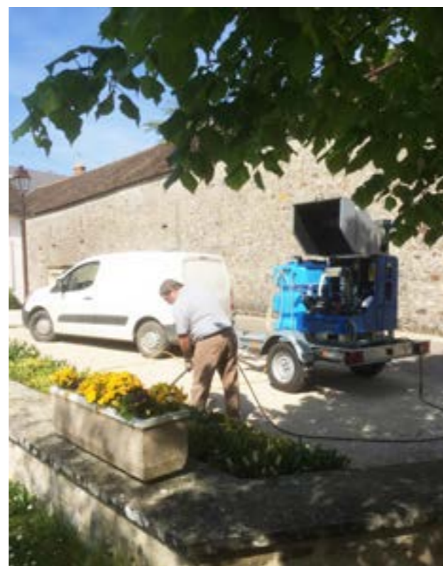
Machine à désherbage à eau chaude